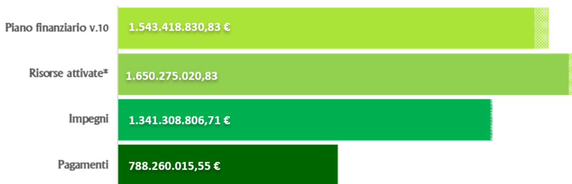
Figura 1 - Avanzamento dell'attuazione al 31.12.2021

Fonte: DG-Agricoltura, Alimentazione e Sistemi Verdi, RAA 2021